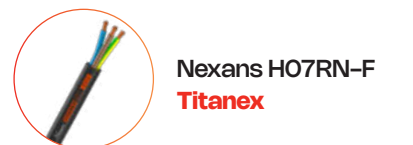
Nexans H07RN-F Titanex