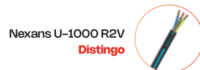
Nexans U-1000 R2V Distingo