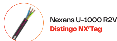
Nexans U-1000 R2V Distingo NX'Tag